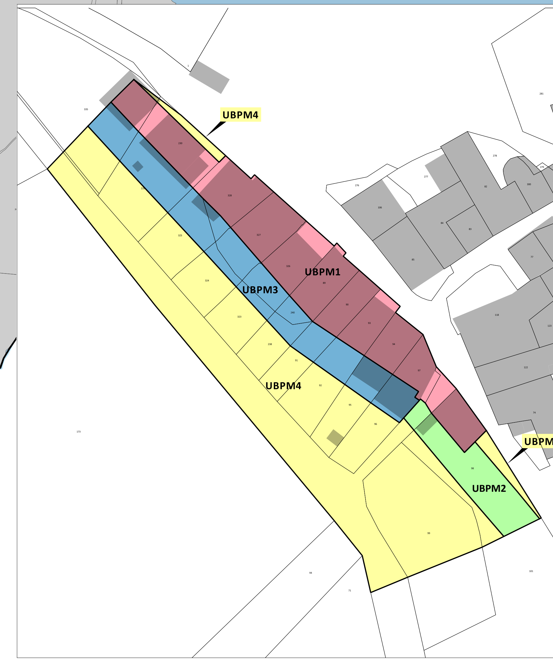
▲ Secteur UBpm / Les Bonfillons - plan masse